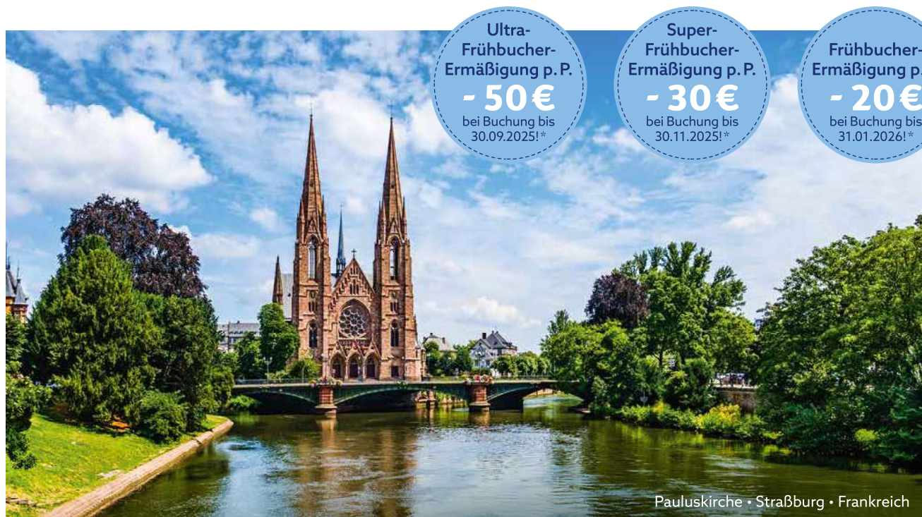
Pauluskirche • Straßburg • Frankreich