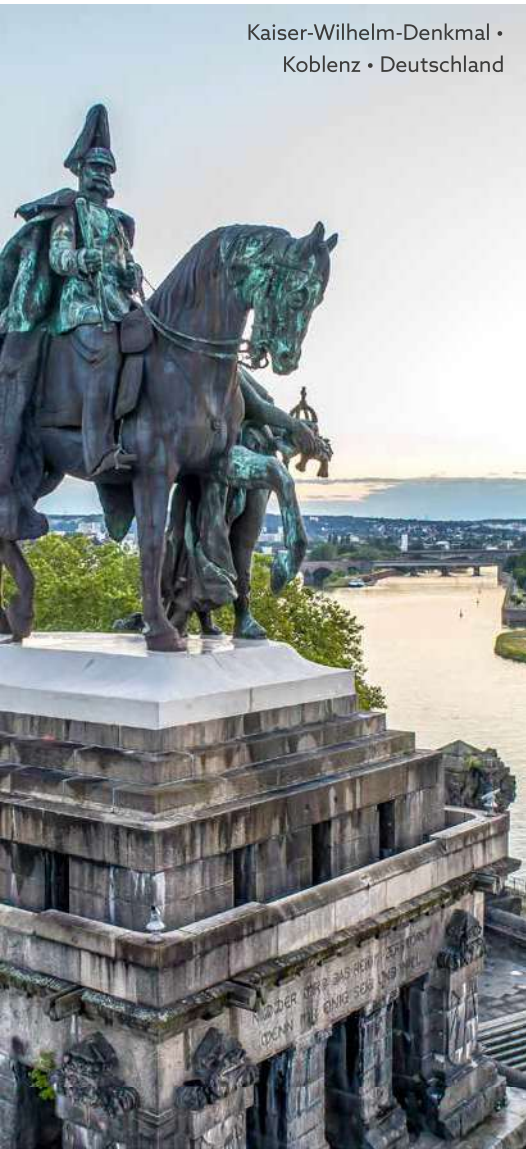
Kaiser-Wilhelm-Denkmal • Koblenz • Deutschland