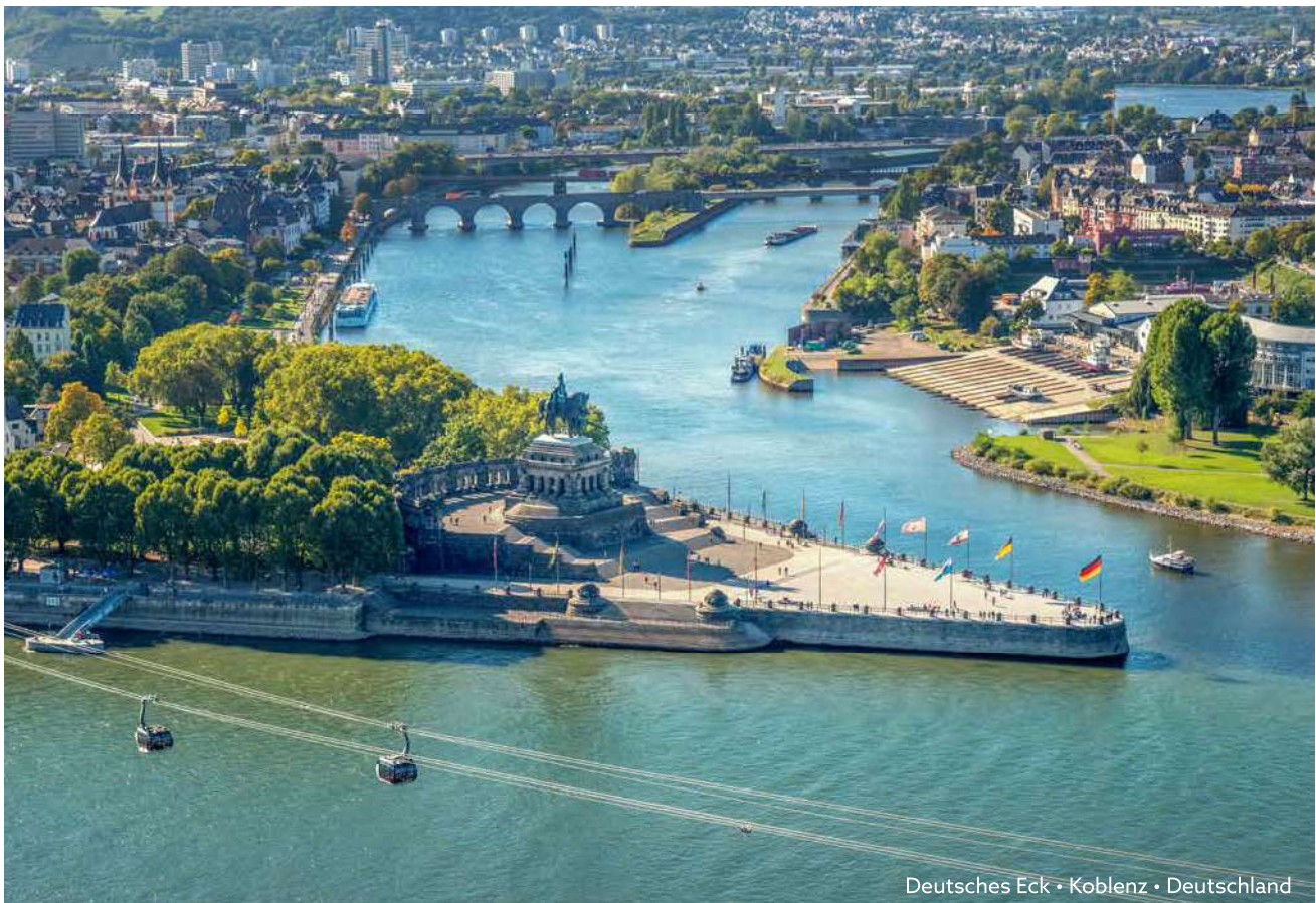
Deutsches Eck • Koblenz • Deutschland

Unter den wachsamen Augen des Kaiser-Wilhelm-Denkmals fließen am „Deutschen Eck“ Rhein und Mosel ineinander