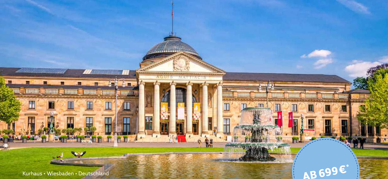
Kurhaus • Wiesbaden • Deutschland