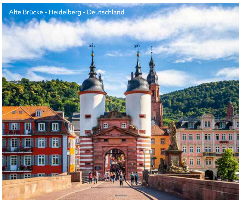
Alte Brücke • Heidelberg • Deutschland